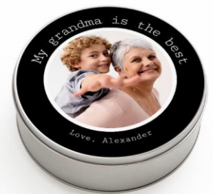
Boîte à biscuits

Trois nouvelles variantes de design parmi celles proposées jusqu'à aujourd'hui pour les boîtes à biscuits rondes sont également d'actualité. Le client a maintenant la possibilité d'y apposer le texte en rond, adapté à la forme de la boîte. smartphoto est régulièrement à la recherche d'idées et de produits nouveaux et innovants, afin d'élargir sa gamme et de proposer au client une large palette et beaucoup de possibilités, pour mettre ses produits en lumière. Plusieurs nouveaux produits sont dans les pipelines et smartphoto se réjouit de pouvoir présenter ceux-ci, dans les mois à venir.