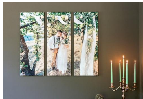
Polyptyque 1

Trois nouvelles variantes de design parmi celles proposées jusqu'à aujourd'hui pour les boîtes à biscuits rondes sont également d'actualité. Le client a maintenant la possibilité d'y apposer le texte en rond, adapté à la forme de la boîte. smartphoto est régulièrement à la recherche d'idées et de produits nouveaux et innovants, afin d'élargir sa gamme et de proposer au client une large palette et beaucoup de possibilités, pour mettre ses produits en lumière. Plusieurs nouveaux produits sont dans les pipelines et smartphoto se réjouit de pouvoir présenter ceux-ci, dans les mois à venir.